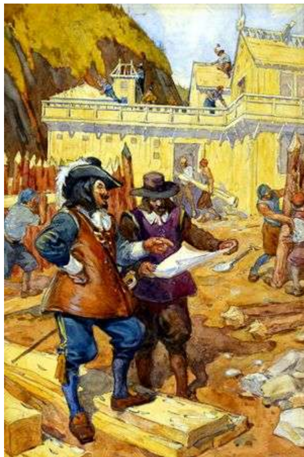
Pintura que ilustra la construcción de la «habitación» de Quebec, del autor Charles William Jefferys.

En 1608, Samuel de Champlain vuelve a Nueva Francia como teniente de la expedición, con la misión de preparar la creación de una colonia a orillas del río San Lorenzo. Entonces, Samuel de Champlain funda «la habitación» de Quebec, que consiste en un conjunto de edificios unidos entre sí.