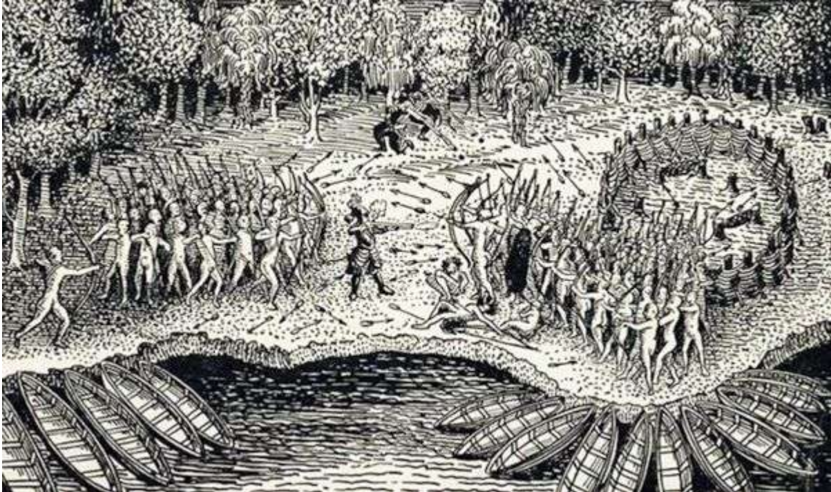
Grabado que muestra la derrota de los iroqueses en el lago Champlain en 1609.

Aunque este último no logra que se renueve su privilegio del comercio de las pieles, sí que consigue convencer a algunos comerciantes de Ruan para formar una sociedad con él y con Samuel de Champlain. Estos aceptan respaldar la colonia a condición de que una parte de la «habitación» de Quebec sirva como almacén exclusivo para el comercio.