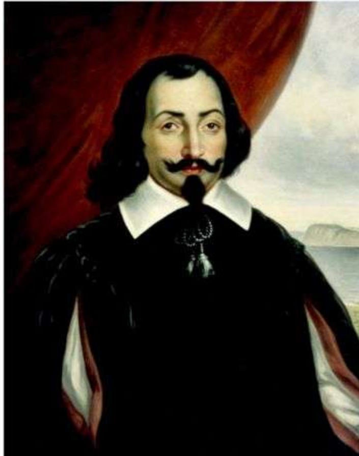
Retrato de Samuel de Champlain.

¿Nacimiento? Entre 1574 y 1580 en Brouage (Francia).