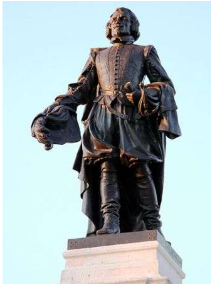
Estatu de Samuel de Champlain en Quebec.