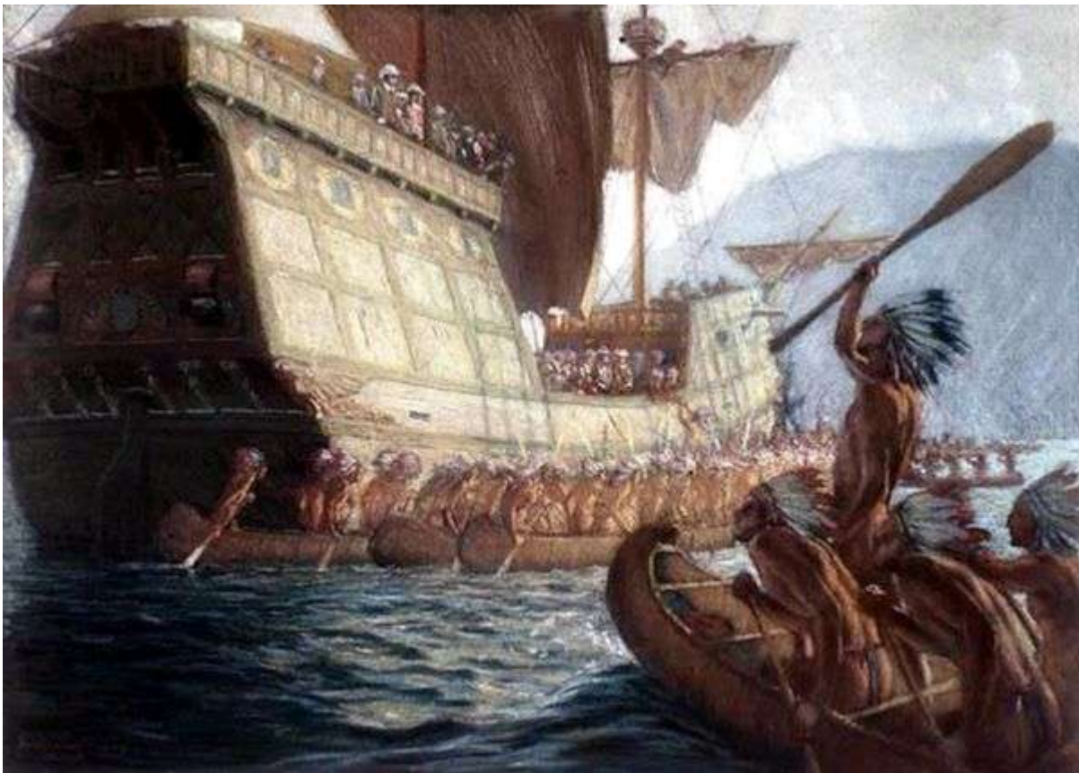
Pintura que muestra la llegada de Champlain a Canadá.

Grand Sault Saint-Louis, la «catarata San Luis» (los rápidos de Lachine), donde no puede avanzar más. Gracias a la información que le facilita la población local, puede reproducir con detalle la configuración de los Grandes Lagos y la de la bahía de Hudson, pero sigue estando convencido de que el mar de Asia está cerca. Vuelve a Francia el 20 de septiembre, donde el navegante presenta un informe de la expedición al rey Enrique IV y publica sus observaciones con el título En lo referente a los salvajes, o, el viaje de Samuel Champlain, desde Brouage, hecho en Nueva Francia en 1603 .