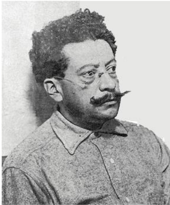
Ricardo Flores Magón, líder anarquista mexicano.

Este contexto hizo posible que la revolución política y la social fueran de la mano, al permitir la alianza entre burgueses y campesinos. Así, en 1906, el movimiento liberal impulsó un alzamiento en la sierra de Sotepan, del Estado de Veracruz, en la que se involucraron los indios popolucas, víctimas de la familia de Manuel Romero, suegro y ministro de Porfirio Díaz, que pocos años antes los había despojado de sus tierras.