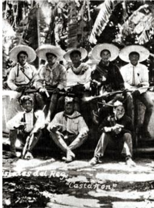
Cristeros, protagonistas de una revuelta contra el gobierno revolucionario en nombre de los principios católicos.

Los cristeros contrataron al general Enrique Gorostieta para que dirigiera sus fuerzas. Fue un acierto, porque Gorostieta consiguió transformar las guerrillas descoordinadas en un verdadero ejército. Ante la imposibilidad de someterlo, el gobierno tuvo que avenirse a pactar. La jerarquía eclesiástica, por su parte, acabó por dejar en la estacada a los sublevados, de los que siempre había recelado. Mientras ellos combatían, los obispos se hallaban en el exilio, por lo que no existió coordinación entre unos y otros.