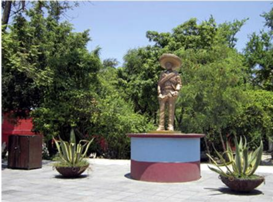
Monumento al zapatismo en el Museo de la Revolución del Sur, Tlaltizapán.

Tenía que ver, más bien, con una filosofía hedonista de la vida que le hacía apreciar a las mujeres hermosas, los buenos caballos, los gallos de pelea. Estas aficiones, seguramente, sirvieron para que ganara simpatías populares antes que para lo contrario.