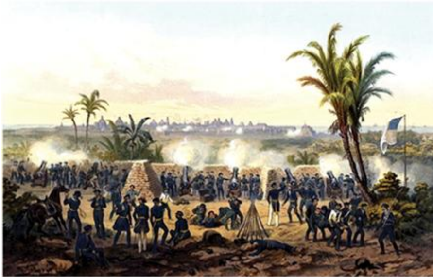
Tropas estadounidenses durante la ocupación de México en la guerra de 1846-1848. Grabado de la época.

Unidos no estaba dispuesto a seguir apoyando una aventura que creía sólo beneficiosa para el sur. Así, México evitó un mal aún mayor al conseguir la devolución de la Baja California y una indemnización de quince millones de dólares. Esta suma iba a permitir la adquisición de material militar con el que restablecer el orden en Yucatán, escenario de una revuelta maya de gran amplitud; en el centro del país, víctima del bandolerismo generalizado; y en el norte, donde las tribus indias realizaban continuas incursiones.