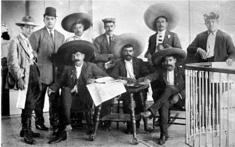
Emiliano Zapata Salazar (1879-1919), en el centro, rodeado de sus colaboradores. Junio de 1911.