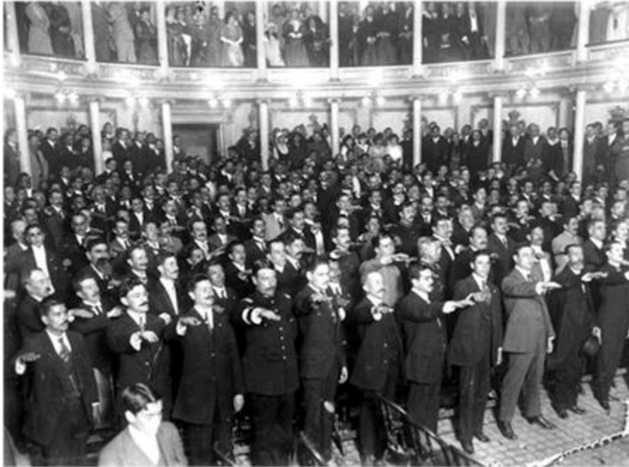
Los miembros del Congreso Constituyente de 1917 juran la nueva constitución de los Estados Unidos Mexicanos.

El catolicismo, a partir de entonces, quedó desprovisto de la facultad de intervenir en la enseñanza primaria, tema siempre sensible porque implicaba quién influiría sobre la formación de las conciencias. Los templos pasaban a ser propiedad del Estado, que se reservaba el derecho de establecer en qué casos debían continuar destinados al culto público. Las órdenes monásticas, por el artículo 5, quedaban suprimidas. A su vez, el artículo 130 prohibía a los sacerdotes realizar críticas contra el gobierno o la constitución. Se llegaba así al extremo de negar a un colectivo los derechos políticos del conjunto de la población.