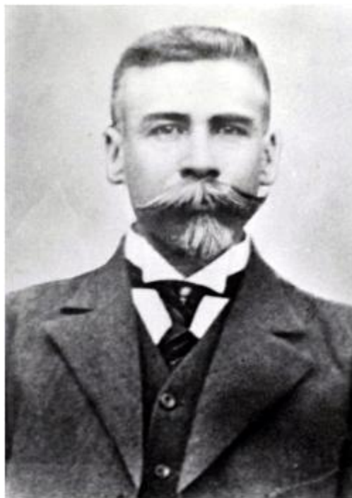
El senador Belisario Domínguez. Murió asesinado por denunciar la tiranía de Huerta.

represión despiadada contra los disidentes. Como el caso del senador Belisario Domínguez que intentó pronunciar en la Cámara un discurso crítico. Como no se lo permitieron, lo llevó al papel gracias a una mujer, que tuvo el valor del que carecieron unos impresores asustados. En el texto denunciaba al presidente por haber asesinado cobardemente a Madero y por no lograr la pacificación del país, sumido en una espiral creciente de violencia. El Congreso, por tanto, debía deponer al «soldado sanguinario y feroz» que dirigía el gobierno.