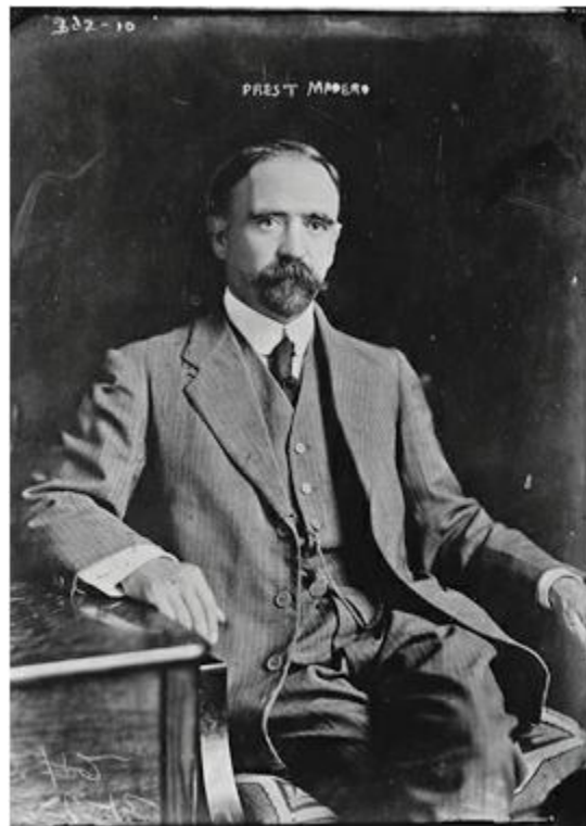
Francisco I. Madero, presidente de México de 1911 a 1913.

convertirle en una especie de semidiós, como si no hubiera otro hombre capaz de igualarle en sus dotes extraordinarias. «Todos sabemos que lo comparan con Napoleón y Washington —escribe Madero—, que le declaran más grande que Bolívar y deducen que la Nación tiene para él una deuda de gratitud que nunca le podrá pagar».