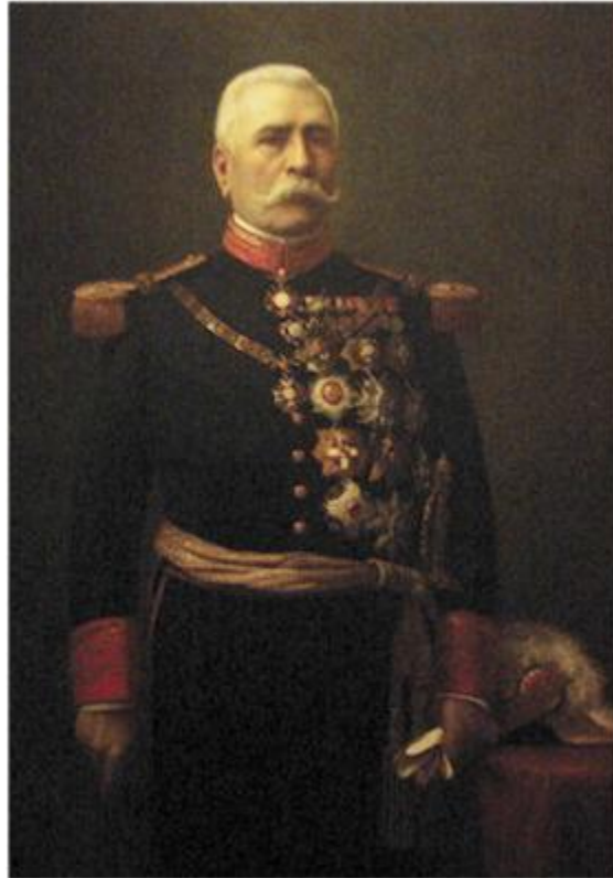
Porfirio Díaz, presidente de México, de autor desconocido. El lienzo se encuentra en el museo del templo de Santo Domingo de Guzmán, Oaxaca de Juárez.

Los primeros, un grupo de tecnócratas, provenían de las clases medias urbanas, aunque el ejercicio del poder acabó asimilándolos en algunos casos con la oligarquía. Apenas cincuenta personas, cien como mucho, llevaron a cabo una política modernizadora que implicó suprimir las aduanas interiores, racionalizar el sistema tributario o impulsar la enseñanza pública. Sin embargo, su altanería y su autoritarismo concitó el odio generalizado de sus enemigos, hasta el punto de que científico se convirtió en sinónimo de enemigo del pueblo. Personificaban, más que nadie, el mal. Según diría uno de ellos, Francisco Bulnes, se les tenía por más