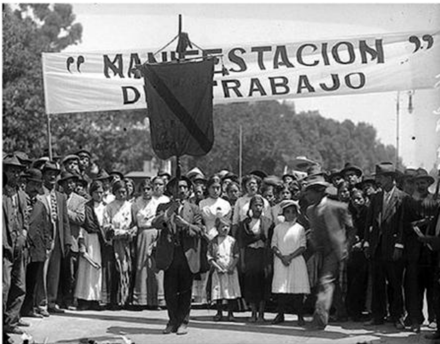
Manifestación obrera durante la Revolución mexicana.