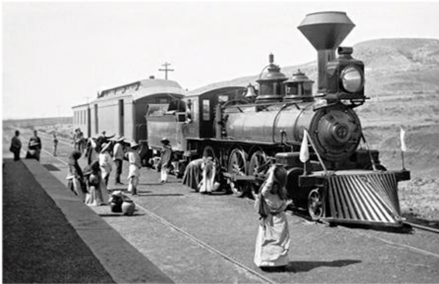
El ferrocarril mexicano en tiempos de Porfirio Díaz.

modernidad coexistían en los modos de producción mientras grandes masas de población se veían excluidas de la riqueza. Además, el intenso crecimiento demográfico hacía que el aumento de la riqueza nunca fuera suficiente. A lo largo del período, la población pasó de nueve a quince millones de habitantes.