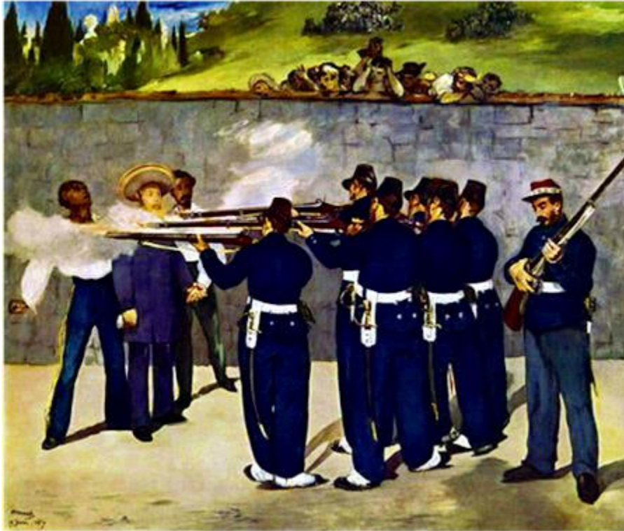
MANET, Édouard. La ejecución de Maximiliano (1868). Kunsthalle Mannheim, Alemania. El soldado de la derecha tiene los rasgos de Napoleón III.

la independencia mientras gobernaba gracias a un ejército extranjero?