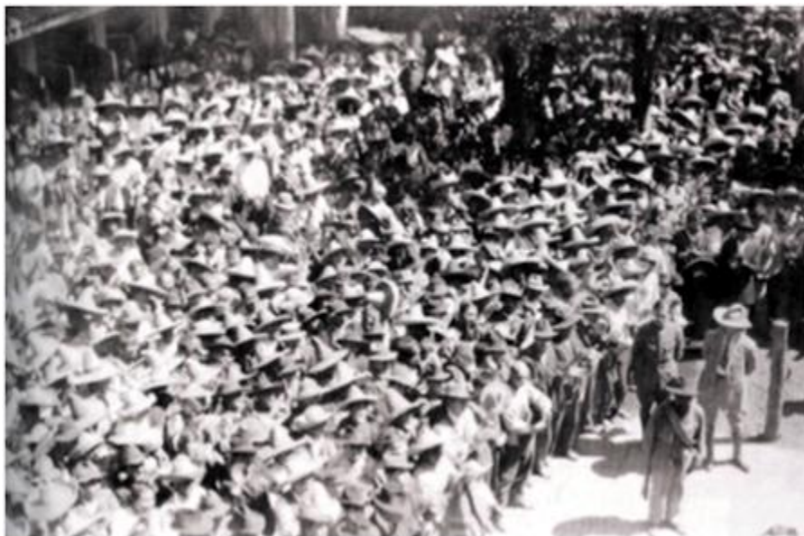
Zapatistas. Su revuelta encarna el agrarismo más radical de la Revolución mexicana.

Mientras tanto, aquellos que permanecían en las fábricas no parecían interesados en subvertir el capitalismo, sino en obtener pequeñas mejoras en sus condiciones de vida. Seguían una estrategia «economicista», según decía, peyorativamente, la izquierda radical.