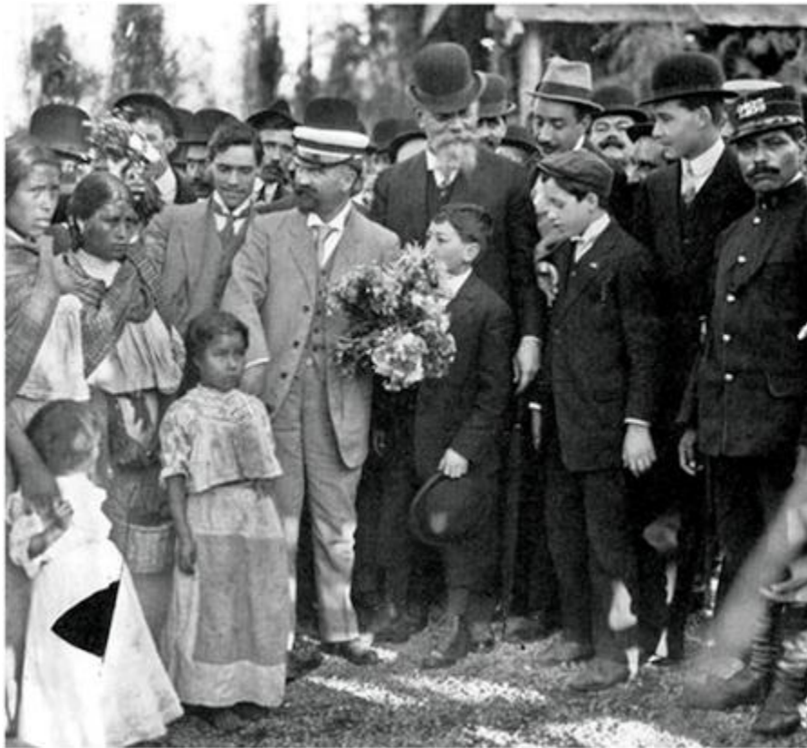
Madero rodeado de admiradores en un acto político.

hallaban entre su público representaban a la mujer de corazón abnegado, siempre dispuesta al cuidado de sus semejantes. No se les concedía el derecho a «inmiscuirse» —el verbo ya lo dice todo— en los asuntos de la política, pero nadie mejor para inculcar a los niños, a los futuros ciudadanos, «el amor a la patria y a la libertad».