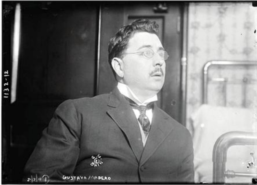
Gustavo Adolfo Madero (1875-1913), hermano del presidente Francisco Ignacio.

Por una vez, las riendas de México estaban en manos de un político honesto. Aunque eso no fue obstáculo para que se repitieran las acusaciones de corrupción contra sus parientes, que a la postre debilitarían profundamente su presidencia, contribuyendo a su caída final. Se rumoreaba que su hermano Gustavo se hallaba metido en varios negocios poco claros. Supuestamente, había aprovechado su posición para aprovisionar las bodegas del Palacio Nacional y del Castillo de Chapultepec. Se decía, también, que había hecho dinero con el amueblado de la Secretaría de Comunicaciones. Casi un año después de la muerte de Madero, El demócrata fronterizo , un periódico de Laredo, Texas, resumiría así una percepción extendida acerca del líder y su entorno: «Él personalmente era un hombre honrado y quizá un hombre de buena