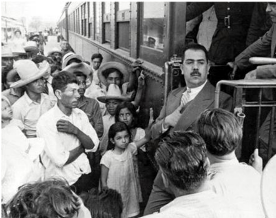
El presidente Lázaro Cárdenas (1895-1970), gran artífice de la reforma agraria mexicana.

historia oficial, si brilla, es por su ausencia: «En el transcurso del siglo, la distribución del ingreso y la riqueza nunca mejoró significativamente. No se redujeron la discriminación ni el racismo de los mestizos, no cambió la estructura estamental, casi de castas, que arrastramos desde la Colonia».