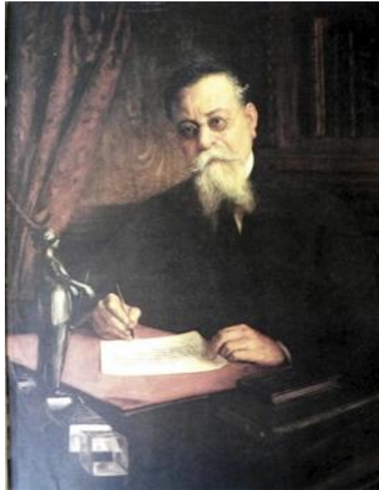
Venustiano Carranza, jefe de las fuerzas constitucionalistas.

Pese al tópico, la Revolución mexicana no fue forzosamente sinónimo de persecución antirreligiosa. En las filas de Zapata, como en las de Villa, también encontramos creyentes y hasta sacerdotes que asistían espiritualmente a las tropas. Por eso, en Cuernavaca, el obispo disponía de protección y no tuvo necesidad de exiliarse, como los del resto del país. La importancia de la religión, según Jean Meyer, separó al zapatismo de otros movimientos con los que ha sido comparado, entre ellos los anarquistas. No en vano sus hombres luchan bajo el estandarte de la Virgen de Guadalupe.