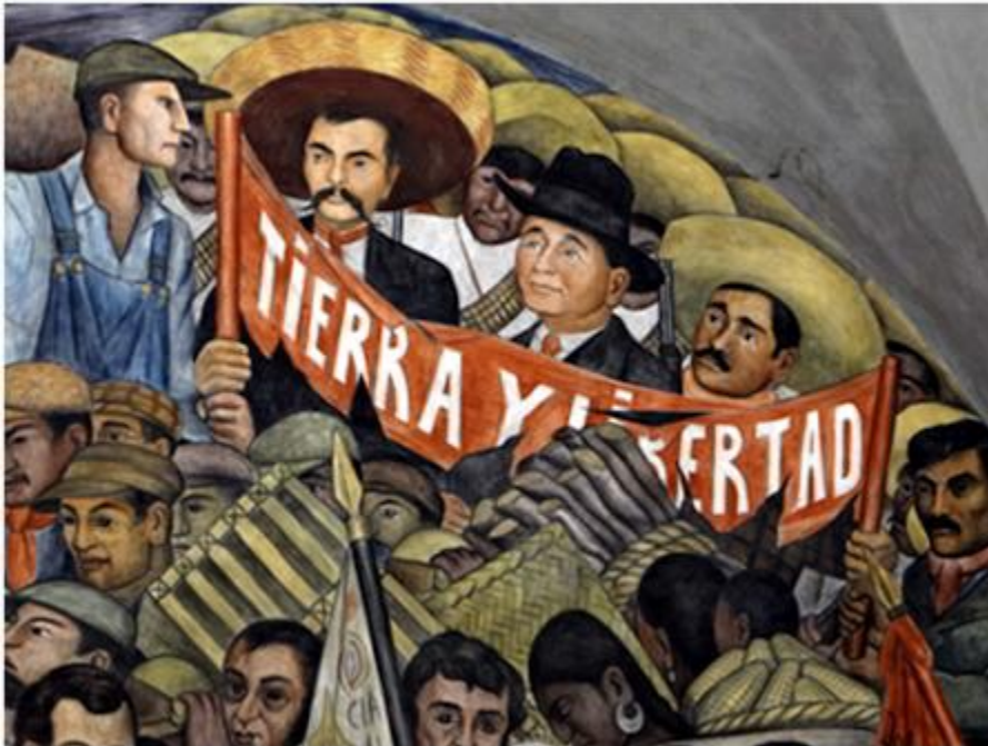
Emiliano Zapata visto por el pintor Diego Rivera.

evangélico para enseñar a leer y escribir al prójimo; entonces sí se sentía en el pecho y en el corazón de cada mexicano, que la acción educadora era tan apremiante y tan cristiana como saciar la sed o matar el hambre».