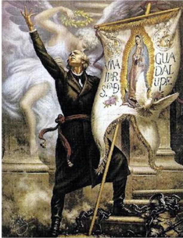
El cura Hidalgo (1753-1811), héroe de la independencia mexicana, con un estandarte de la Virgen de Guadalupe.

miembros ocuparan los cargos públicos en lugar de los peninsulares.