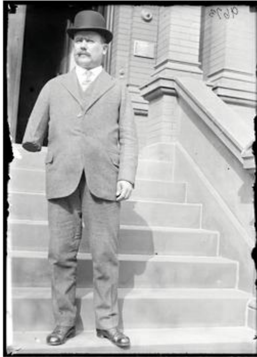
El general Álvaro Obregón en 1917. Aparece sin el brazo derecho que había perdido en combate.