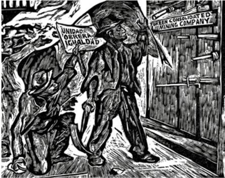
Movilización de los trabajadores mexicanos contra una empresa minera extranjera, la Mining Company.

optado por el cierre, tras rechazar una propuesta de mediación del gobierno y las moderadas propuestas de los huelguistas.