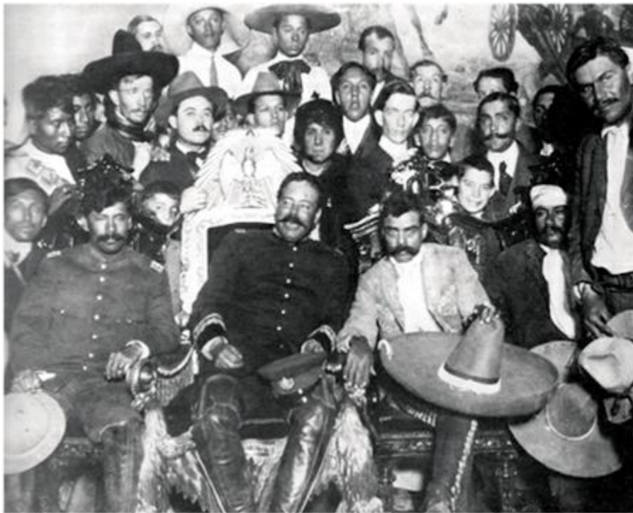
Pancho Villa y Emiliano Zapata en Ciudad de México, 1914.

seguridad de la mayor concentración humana del país. Además, pronto estallaron los altercados entre hombres de uno y otro ejército. No obstante, las riñas estaban lejos del apocalipsis que habían temido los habitantes de México D. F., propensos a identificar a los zapatistas con los nuevos bárbaros. En contra de lo que muchos esperaban, los sureños no se habían lanzado a ninguna orgía destructiva. Tampoco los villistas, que debían acatar las estrictas órdenes de su jefe contra el saqueo. Pero ninguna autoridad podía impedir que, a medida que pasaban los días, los problemas se multiplicaran.