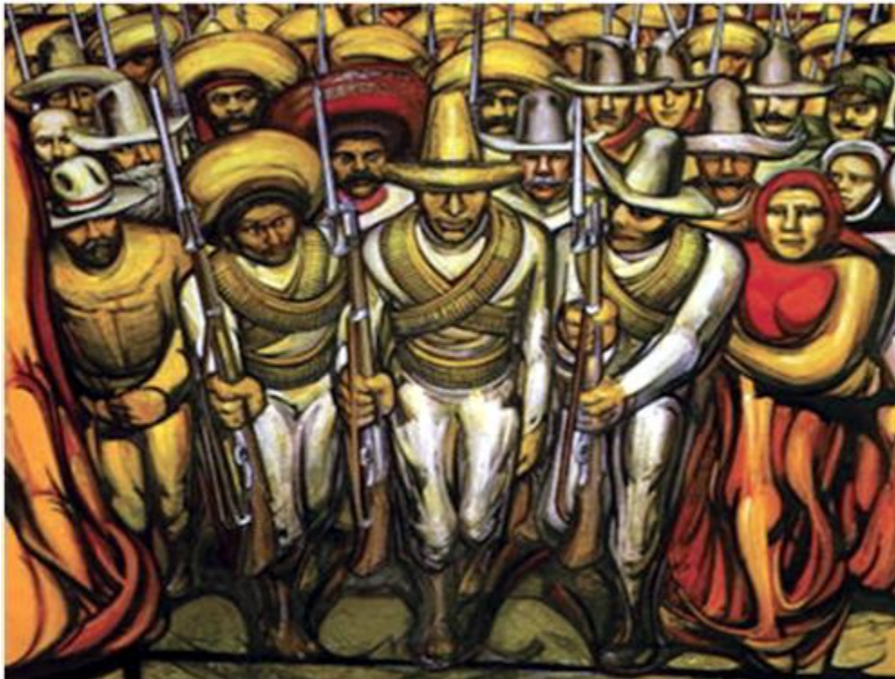
El pueblo en armas. Mural en acrílico de David Alfaró Siqueiros, 1957-1965. Museo Nacional de Historia, Ciudad de México.

Desalojado Díaz del poder en 1911, la revolución se extendió durante una década en la que se mezclaron las luces y las sombras, los anhelos de justicia social con las arbitrariedades de los señores de la guerra, capaces de decidir con un gesto el destino de vidas y haciendas.