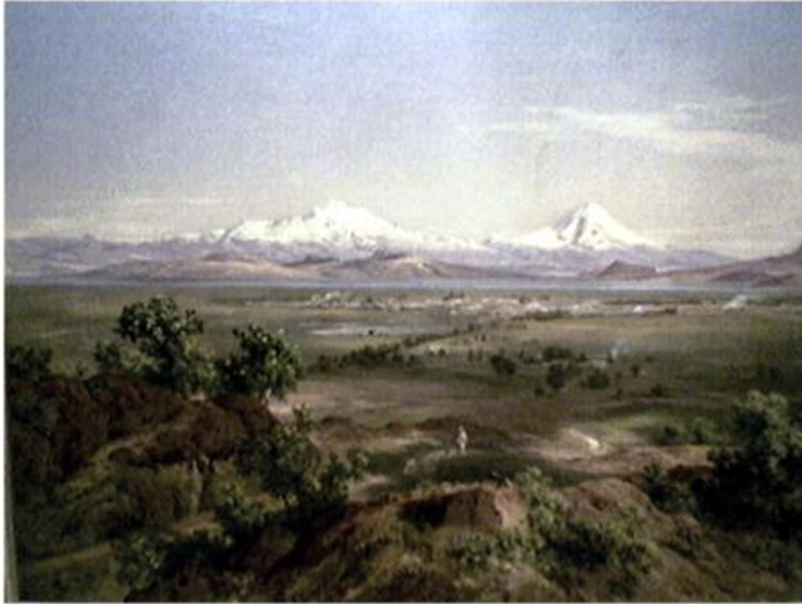
El Valle de México, por José María Velasco, 1885. El paisajismo experimentó un gran desarrollo bajo el Porfiriato.

Díaz, al impedir el libre funcionamiento asociativo, impedía canalizar la solución de los problemas por una vía institucional.