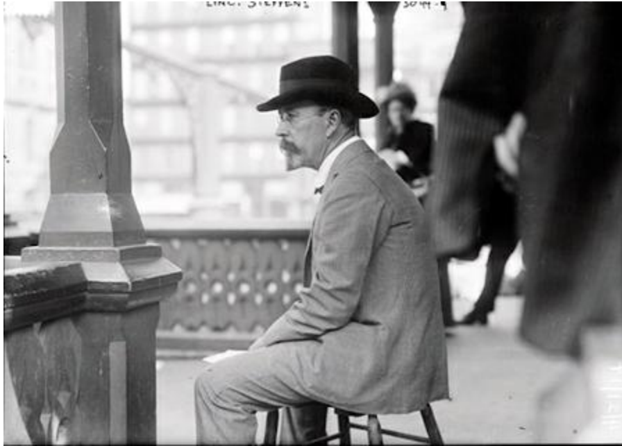
El periodista norteamericano Lincoln Steffens (1866-1936) en Nueva York, abril de 1914.

Con mordacidad irreverente, Steffens comparó el intervencionismo de la Casa Blanca con la actitud de alguien que pretendiera cometer una violación pero sólo «un poco», algo imposible por definición. Si los estadounidenses tenían parte de culpa por lo que sucedía en su vecino del sur, no podían pretender ser la solución a los problemas. No les faltaba capacidad para imponerse por las armas, pero, si llegaban a hacerlo, sería al precio de una carnicería. Porque los mexicanos —afirmó Steffens— no tenían miedo a morir. Cuando los hombres caían, las mujeres recogían los rifles y continuaban disparando.