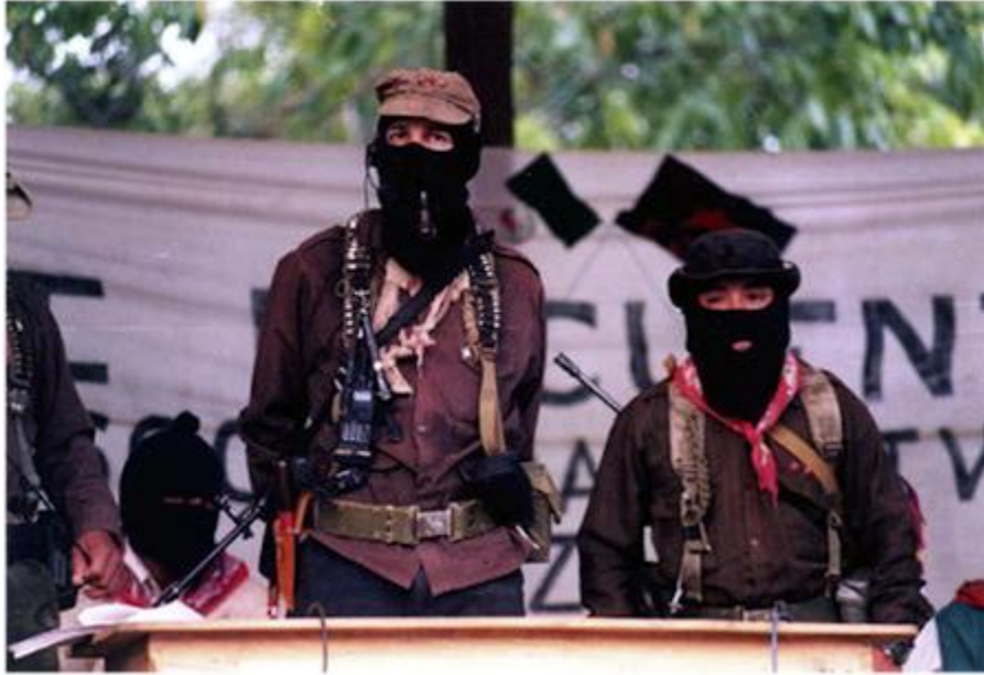
El subcomandante Marcos, misterioso líder de la revuelta neozapatista que estalló en Chiapas en 1994.

El éxito del EZLN no fue nada desdeñable. Como señala Monsiváis, consiguieron por primera vez en la historia de México que un movimiento indígena acaparara las miradas y tuviera repercusión en el extranjero. Su movilización también aportó la novedad de suscitar el debate sobre los derechos de los indígenas. Esta vez eran las propias víctimas de la marginación quienes hablaban, no blancos bienintencionados que teorizaban desde fuera sobre su situación. Hablaban y planteaban una problemática que no admitía más demoras.