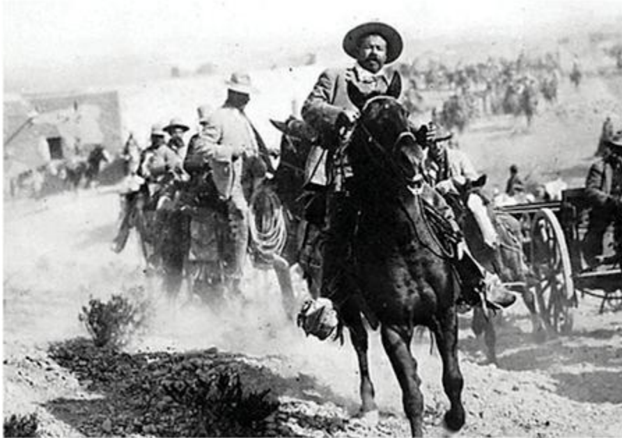
Pancho Villa a caballo. El Centauro del Norte era un excelente jinete.

intentado una reforma al estilo de los zapatistas, se hubiera estrellado contra la falta de una mayoría social que le respaldara.