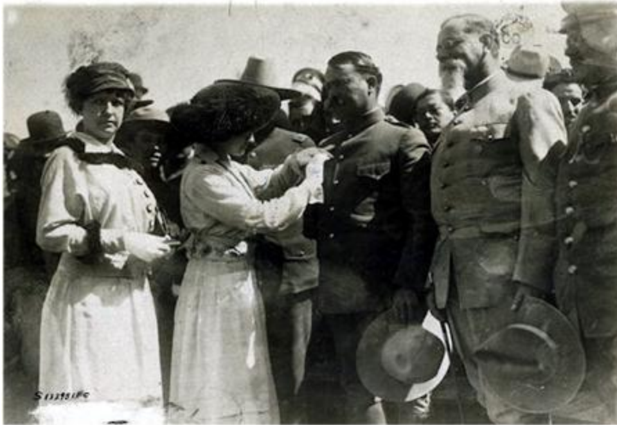
El general Obregón es condecorado tras la batalla de Celaya. A su derecha se encuentra Venustiano Carranza.

garantizar que un hecho como el de Columbus no se repitiera. Si los mexicanos no se veían capaces de vigilar su frontera, debían permitir que los estadounidenses hicieran el trabajo.