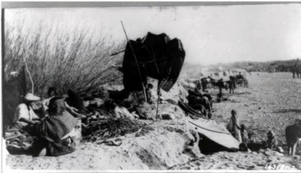
Mujeres y niños refugiados tras una batalla.

Según Javier Garciadiego, a muchos militares no les preocupaba vencer ya que la continuidad de las hostilidades favorecía sus intereses privados: «Les convenía seguir luchando, pues además de recibir su salario, así fuera tarde o incompleto, tenían la oportunidad de lucrar con la población pacífica, con los recursos gubernamentales y hasta con los bienes de los alzados».