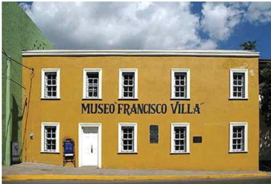
Museo Francisco Villa en Hidalgo del Parral, localidad donde el Centauro del Norte fue asesinado en 1923.

sobre la unidad popular, llega el momento de reivindicar a Pancho Villa como un auténtico revolucionario. Equivocado, tal vez, pero sin duda heroico. Tal imagen no podrá ser aceptada por carrancistas y obregonistas, que se aferrarán a la imagen del bandido siniestro manipulado por intereses reaccionarios.