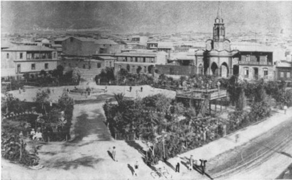
Plaza Colón de Antofagasta, a fines del siglo pasado (1895 a 1898).

El Concurso Histórico Nacional, promovido por la Municipalidad de Antofagasta para establecer los orígenes históricos de esta ciudad, tiende a satisfacer una necesidad cultural del país. No obstante el aporte que han dado las provincias del Norte, Tarapacá y Antofagasta, tanto en el aspecto económico como en el demográfico y social, a lo largo de más de ochenta años, se carece de una historia completa de este territorio, en la que pueda seguirse detenidamente su desenvolvimiento. Aunque el objetivo perseguido a través del Concurso se refiere exclusivamente a la ciudad de Antofagasta, el estudio histórico que responda a ese objetivo significará, también, un aporte a la historia general del Norte.