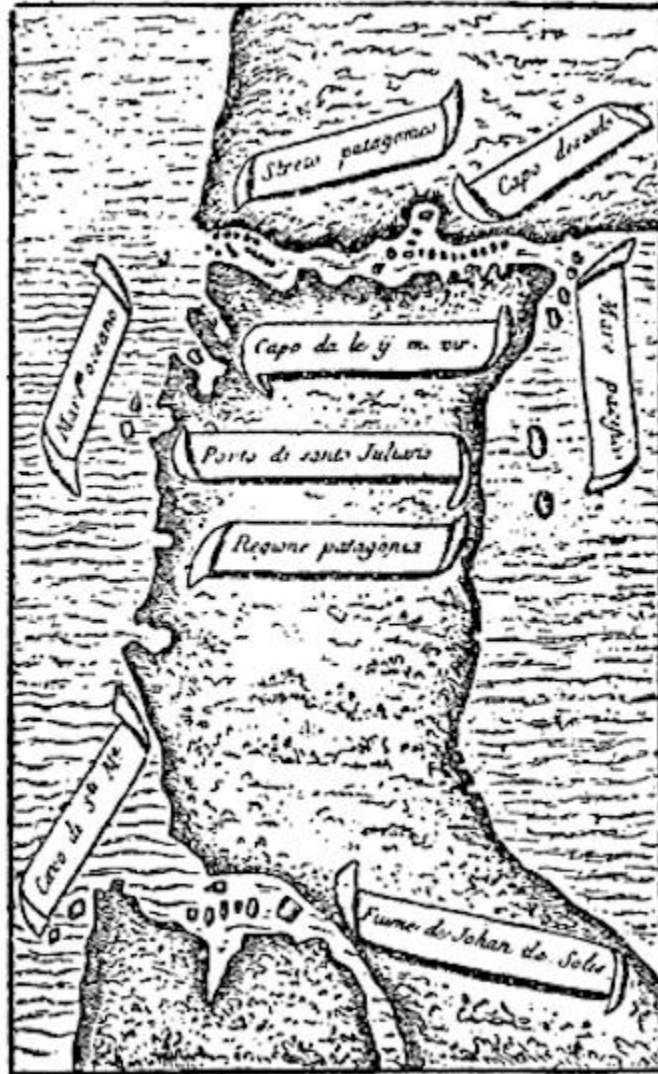
Figura 1. Mapa de la América meridional, según Pigafetta. Se advierten el cabo de Santa María, el río de la Plata, descubierto por Juan de Solís, la región patagónica, el mar Océano, el cabo de las Once mil Vírgenes, el estrecho patagónico, el cabo Deseado y el mar Pacífico.

Manuel hablaba el portugués; subió a bordo y nos dijo que los hijos del rey de Tarenate, aunque enemigos del rey de Tadore, estaban