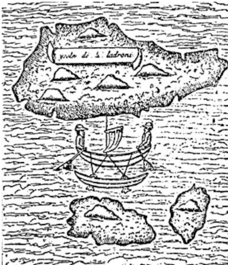
Figura 2. Isla de los Ladrones, según Pigafetta. La barca está emparejada con otra a modo de balancín o batanga.

era que una escuadra de cinco navíos, al mando de Fernando Magallanes, había partido de Sevilla para ir a descubrir las Malucco en nombre del rey de España; y que el rey de Portugal, tanto más disgustado de la expedición, cuanto que aquél era uno de sus súbditos que buscaba su daño, envió navíos al Cabo de Buena Esperanza y al cabo de Santa María 230 , en el país de los caníbales, para interceptarle el paso en el mar de las Indias; pero que no le habían encontrado.